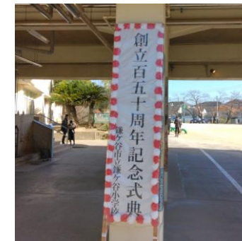
創立150周年記念式典

令和5年(2023年)は千葉県誕生、鎌ヶ谷小学校創立が150周年を迎えた。これまでの150年を振り返り、歴史や文化を再認識することで、郷土愛に繋がるのではないかと。素晴らしい伝統を引き継ぎながら、次世代とともに次の200周年を目指していきたい。