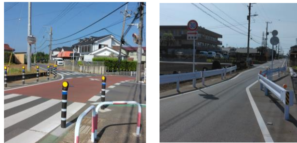
八街市で実施されたポールと狭さく設置