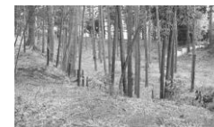
下総小金中野牧・捕込

A 令和3年2月末現在、国が指定した史跡1件、千葉県が指定した史跡1件、本市が指定した史跡や有形文化財など30件、昨年8月に国の登録有形文化財に登録された渋谷家住宅、丸屋離れ2か所5件、埋蔵文化財包蔵地(遺跡)が132か所分布している。