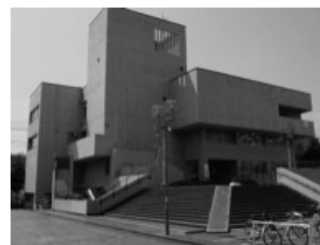
現在の中央公民館

ザ・プライス鎌ケ谷店を含めた鎌ケ谷ショッ ピングプラザが今年4月に閉店してから約2か 月が経った。事業者である(株)モール・エス シー開発はスーパーマーケットを中心とした商業施